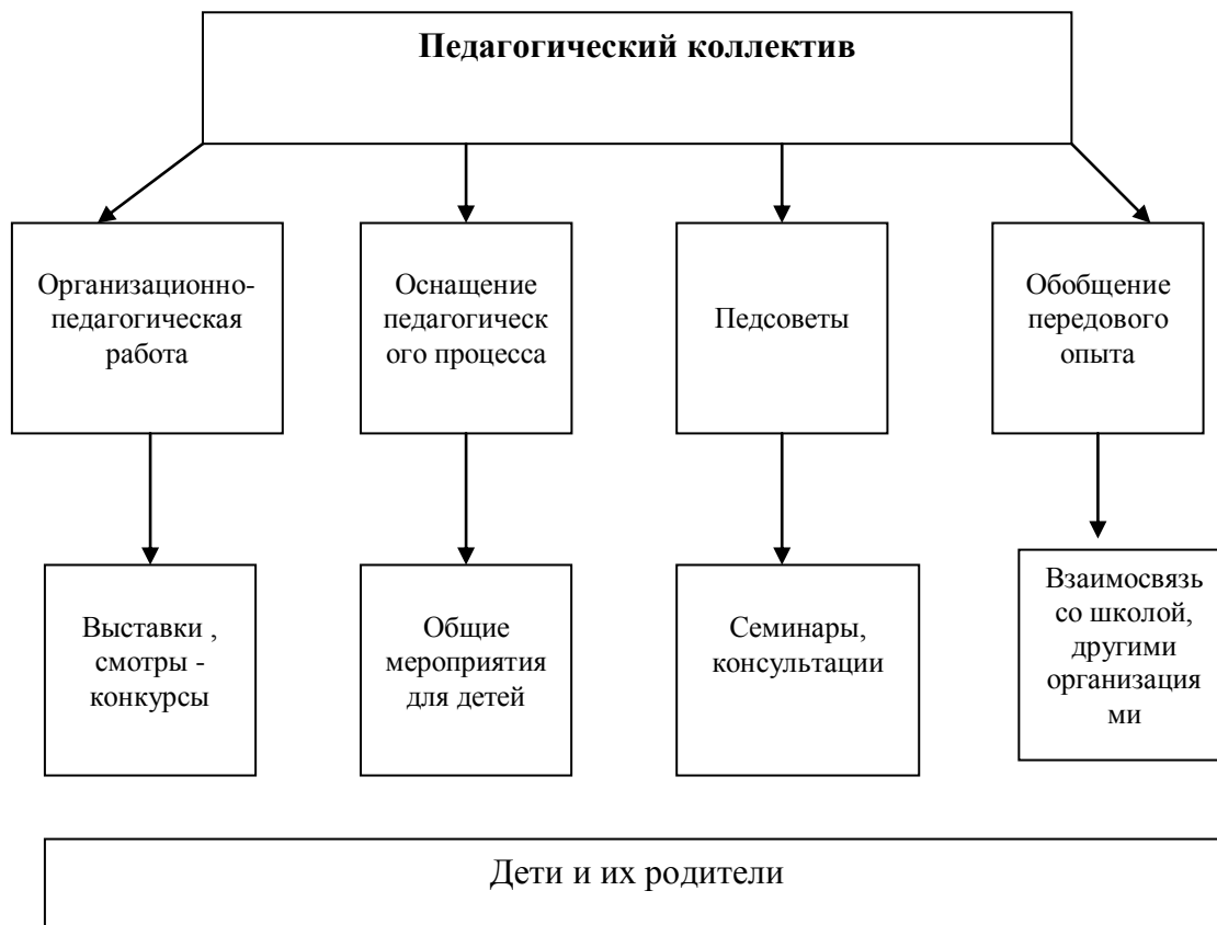
Схема построения воспитательно-образовательного процесса в МБДОУ «Детский сад № 36 «Ягодка».